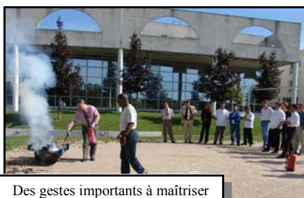
Des gestes importants à maîtriser

En souhaitant par ailleurs que cela ne reste qu'un exercice !