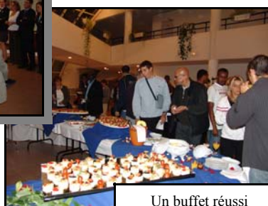
Un buffet réussi