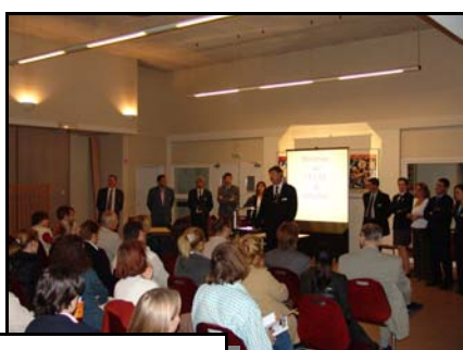
Des parents concernés