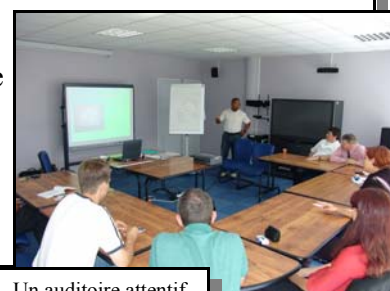
Un auditoire attentif