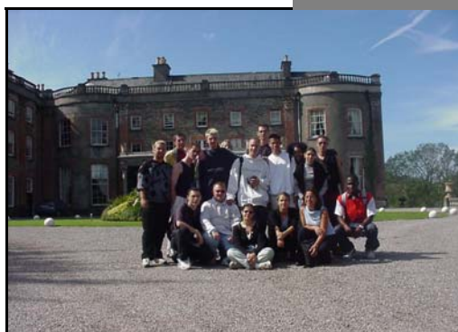
Le groupe en visite à la Bantry House

Trois semaines bien remplies et exploitées de la meilleure façon puisque de l'avis même des formateurs du CEFAA, les progrès de certains sont immédiatement mesurables et pour tous, en tout cas, ce séjour aura permis la prise en confiance en soit dans l'expression de la langue de Shakespeare et de s'ouvrir à d'autres horizons.