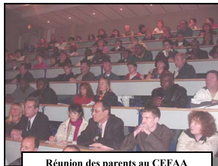
Réunion des parents au CEFAA

A l'issue de ces réunions, un cocktail, préparé et servi par les apprentis fut proposé aux différents participants, très satisfaits de l'accueil réservé et des informations reçues.