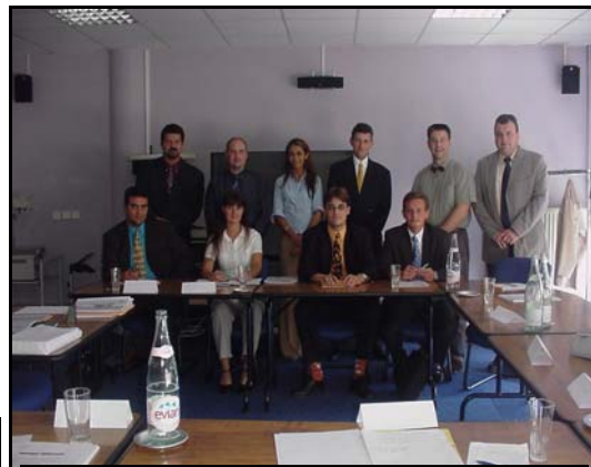
Séminaire de formation de formateurs

Nous souhaitons à tous une bonne adaptation à cette nouvelle fonction.