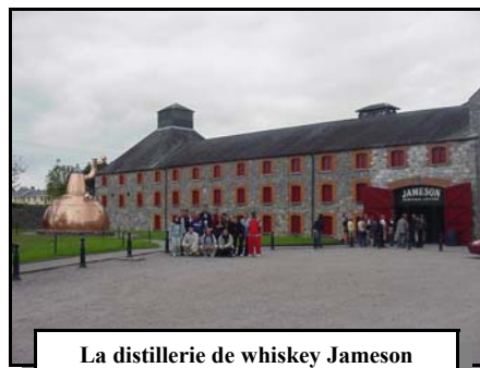
La distillerie de whiskey Jameson

Logés en famille afin de favoriser la pratique de l'anglais, nos jeunes ont pu apprécier la conception de l'hospitalité dans cette région de l'Irlande. Les apprentis ont pu découvrir également la beauté des paysages - l'île de Baltimore et ses dauphins, le phare du Cap Clear, la Bantry House et ses splendides jardins - mais également parfaire leurs connaissances de la fabrication du whiskey grâce à la visite de la distillerie Jameson et des produits locaux (charcuteries, fromages notamment).